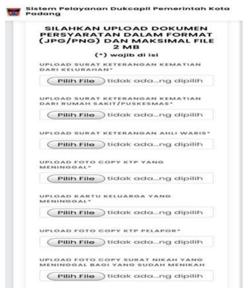
Gambar 3. Persyaratan Akta kematian

Akta kematian merupakan sebuah dokumen yang diterbitkan oleh Dinas Kependudukan dan Pencatatan Sipil yang menyatakan seseorang tidak lagi menunjukkan tanda-tanda kehidupan. Kematian merupakan salah satu peristiwa penting yang dialami oleh seorang penduduk yang perlu dicatatkan oleh negara. Fungsi Akta Kematian ini bagi penduduk biasanya untuk menetapkan status janda atau duda (terutama bagi pegawai negeri, TNI dan Polri), dan juga sebagai persyaratan untuk pembagian warisan. Jika permohonan telah selesai maka akta kematian dapat diambil di kantor kecamatan pemohon. Berikut adalah persyaratan untuk mengurus Akta Kelahiran pada aplikasi online Disdukcapil Kota Padang.