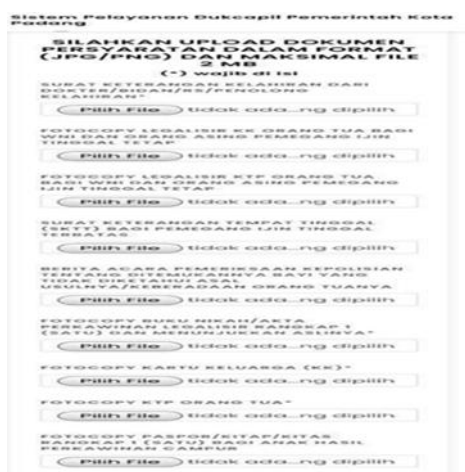
Gambar 2 Persyaratan Akta Kelahiran

Akta kelahiran merupakan dokumen kependudukan yang diperuntukkan kepada setiap bayi yang baru dilahirkan atau penduduk yang belum mempunyai akta kelahiran. Untuk melakukan pengurusan akta kelahiran pada aplikasi online Disdukcapil Kota Padang diperlukan beberapa persyaratan, diantaranya: