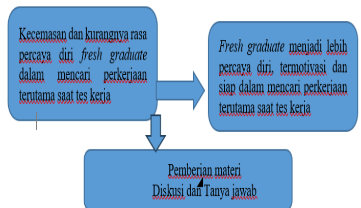
Gambar 1. Kerangka Pemecahan Masalah

Mengingat kondisi yang belum kondusif karena masih dalam suasana pandemi, maka kegiatan pelatihan ini diadakan secara daring melalui aplikasi CloudX. Didasari dengan kondisi di mana fresh graduate menghadapi kesulitan dalam bersaing mencari pekerjaan, kegiatan pengabdian ini bertujuan untuk memberikan bekal bagi fresh graduate agar dapat mempersiapkan diri dengan lebih baik terutama dalam menghadapi tes wawancara dan psikotes. Metode yang digunakan dalam penyampaian materi adalah melalui ceramah dan diskusi. Narasumber juga membagikan pengalaman mereka yang dapat memotivasi peserta dalam mencari pekerjaan.