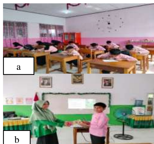
Gambar 5. Pemberian tes sebelum dan sesudah kegiatan (a), pemberian penghargaan (b)

Edukasi ini diharapkan dapat meningkatkan minat siswa terhadap potensi pengolahan ikan secara berkelanjutan. Melalui pendekatan edutainment , siswa lebih mudah memahami dan mengingat manfaat ikan serta teknologi pengolahannya. Mereka juga menjadi lebih antusias untuk mencoba produk olahan ikan di rumah bersama keluarga. Sebagai apresiasi di akhir kegiatan, siswa yang mampu menjawab kuis dengan cepat dan tepat diberikan reward berupa produk olahan ikan yang telah dikemas. Pertanyaan dalam kuis yang diberikan kepada siswa berhubungan dengan proses pengolahan ikan yang telah mereka saksikan dalam video. Pemberian reward ini bertujuan untuk memotivasi siswa agar terus semangat belajar. Kegiatan diakhiri dengan ucapan terima kasih kepada pihak mitra atas dukungannya, sehingga kegiatan dapat berjalan lancar dan sukses, sesuai rencana, dan dengan antusiasme tinggi dari para siswa. Gambar 5 menunjukkan dokumentasi pemberian tes dan penghargaan kepada siswa.