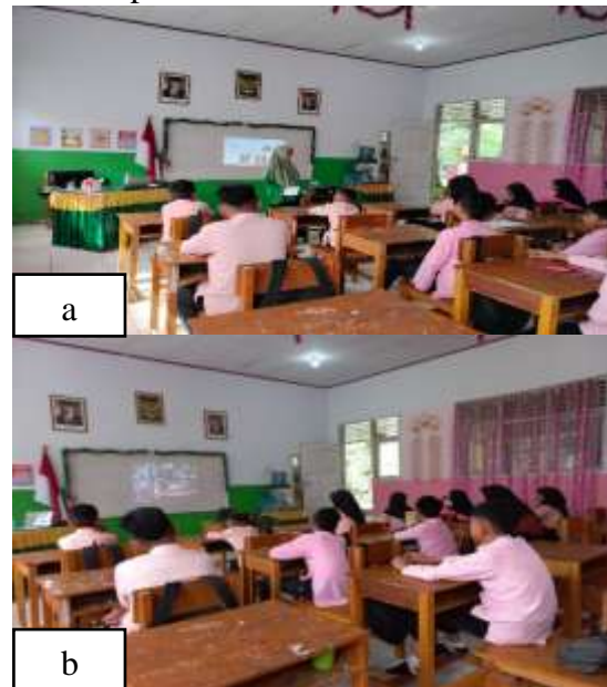
Gambar 3. Pembelajaran dengan Powerpoint (a), pemutaran video pembuatan produk olahan berbahan dasar ikan (b)

pengolahan, hingga distribusi produk ikan olahan ke pasar. Antusiasme siswa dalam kegiatan ini muncul karena pengetahuan yang diperoleh merupakan sesuatu yang baru dan bermanfaat. Dokumentasi kegiatan terlihat pada Gambar 3 pemberian materi kepada siswa.