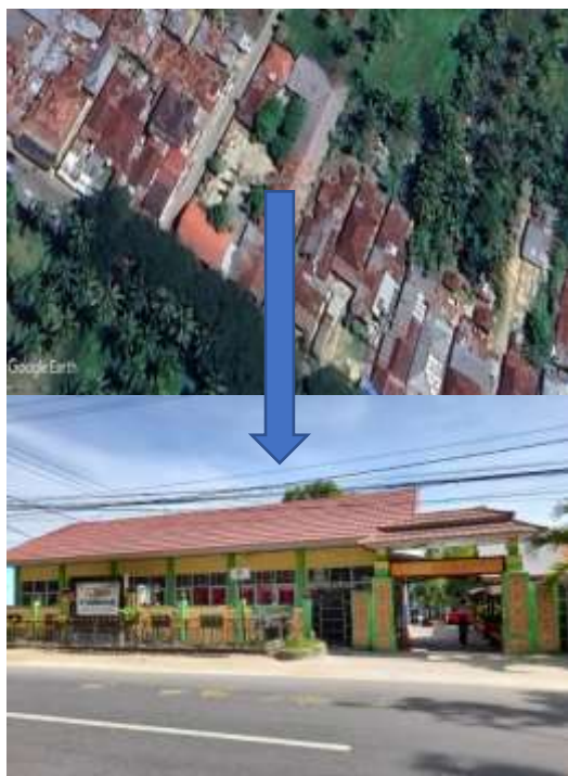
Gambar 1. Lokasi SDN 2 Tabongo

Kegiatan ini menggunakan pendekatan edutainment (edukasi dan hiburan) agar anak-anak lebih antusias belajar. Metode edutainment secara efektif meningkatkan antusias anak-anak untuk belajar dengan mengintegrasikan konten pendidikan dengan kegiatan yang menarik. Metode ini dapat menarik perhatian siswa untuk menumbuhkan lingkungan belajar yang lebih interaktif dan menyenangkan. Bagian berikut menguraikan aspek-aspek kunci tentang bagaimana edutainment memengaruhi motivasi belajar (Pratama et al., 2024). Langkah-langkah pelaksanaan adalah sebagai berikut: