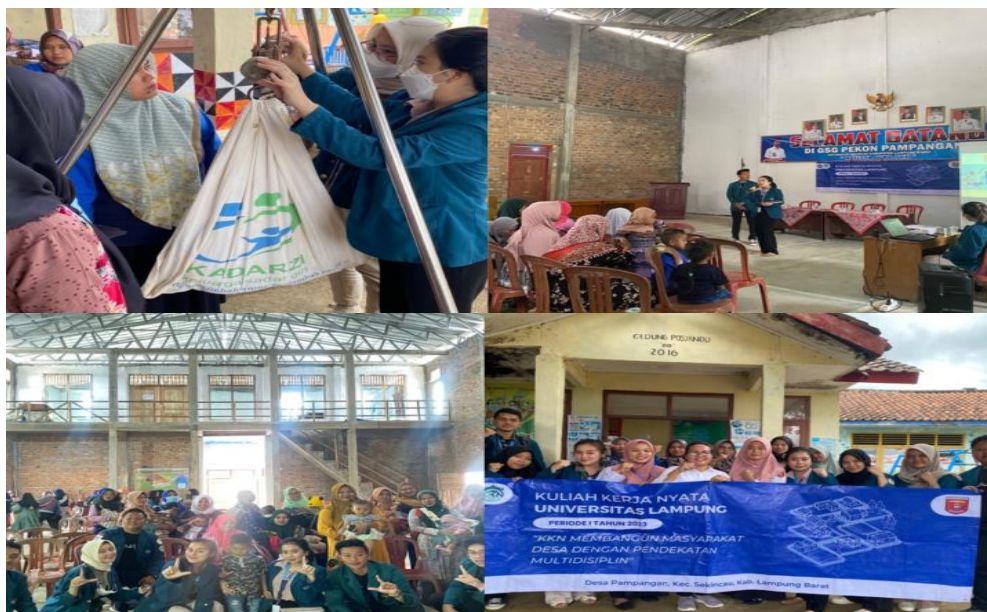
Gambar 2. Dokumentasi penyuluhan pencegahan stunting di Desa Pekon Pampangan

bahan dan perkembangan mereka (Hendi Setiadi & Fifi Dwijayanti, 2020).