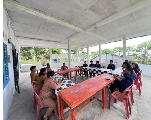
Gambar 1. Kegiatan koordinasi dan audiensi dengan Kepala Desa dan perangkat Desa Silalahi I

Selain itu, dilakukan pemetaan awal terhadap beberapa ruas jalan yang mengalami kerusakan berdasarkan informasi dari masyarakat dan aparat desa. Pemetaan ini bertujuan untuk menentukan lokasi prioritas yang akan menjadi fokus observasi lapangan. Pada tahap ini juga disusun rencana kegiatan, pembagian tugas antar anggota tim, serta penentuan jadwal pelaksanaan program KPPM.