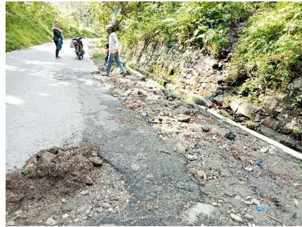
Gambar 2. Genangan air pada musim hujan karena sistem drainase tidak berjalan optimal.

2. Genangan air pada musim hujan karena sistem drainase tidak berjalan optimal.