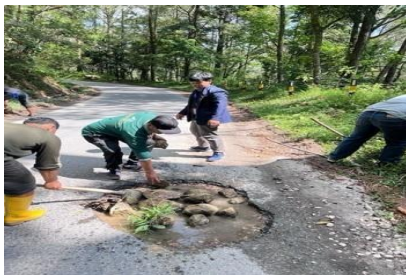
Gambar 1. Permukaan aspal mengelupas dan erosi bahu jalan di Desa Silalahi I

1. Permukaan aspal mengelupas akibat tekanan kendaraan dan erosi bahu jalan