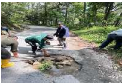
Gambar 1. Permukaan aspal mengelupas dan erosi bahu jalan di Desa Silalahi I

1. Permukaan aspal mengelupas akibat tekanan kendaraan dan erosi bahu jalan