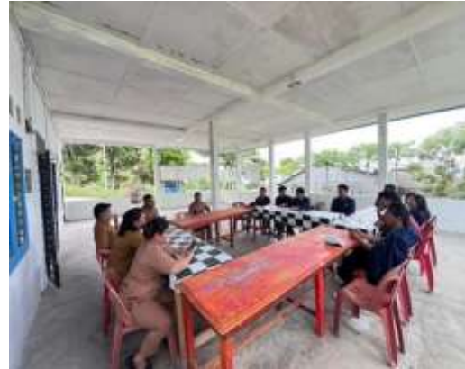
Gambar 1. Kegiatan koordinasi dan audiensi dengan Kepala Desa dan perangkat Desa Silalahi I

Selain itu, dilakukan pemetaan awal terhadap beberapa ruas jalan yang mengalami kerusakan berdasarkan informasi dari masyarakat dan aparat desa. Pemetaan ini bertujuan untuk menentukan lokasi prioritas yang akan menjadi fokus observasi lapangan. Pada tahap ini juga disusun rencana kegiatan, pembagian tugas antar anggota tim, serta penentuan jadwal pelaksanaan program KPPM.