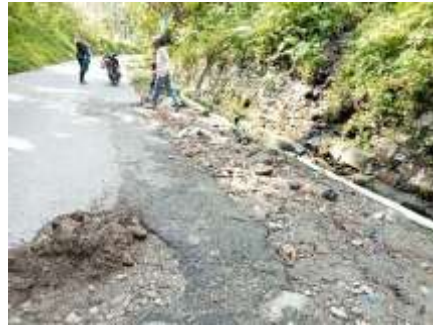
Gambar 2. Genangan air pada musim hujan karena sistem drainase tidak berjalan optimal.

2. Genangan air pada musim hujan karena sistem drainase tidak berjalan optimal.